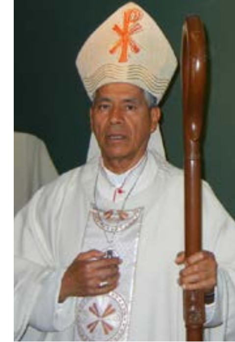
El ministerio de la predicación en el marco de la liturgia

Los más importantes son quienes rezan, quienes hacen suya la exhortación de Jesús, y oran para que el Señor envíe trabajadores a su mies (Mt. 9, 38). Debemos siempre estar agradecidos a los integrantes de la pastoral vocacional por su gran esfuerzo. El último concilio manifiesta la confianza en que el Señor no dejará a su Iglesia abandonada y, que también en el futuro seguirá enviándole un gran número de sacerdotes, con sólo que ella se lo pida (PO. 16).