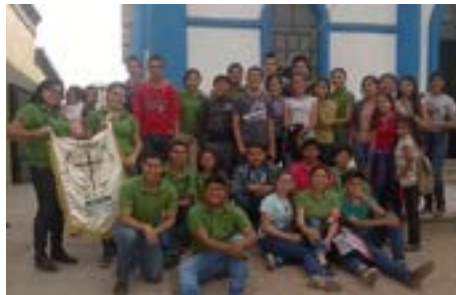
Festejando el día de la Familia: Sector Etchojoa, Huatabampo

Fue un día muy agradable en el cual se convivió y se fortalecieron los valores de la unidad y convivencia Familiar.