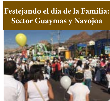
Festejando el día de la Familia: Sector Guaymas y Navojoa