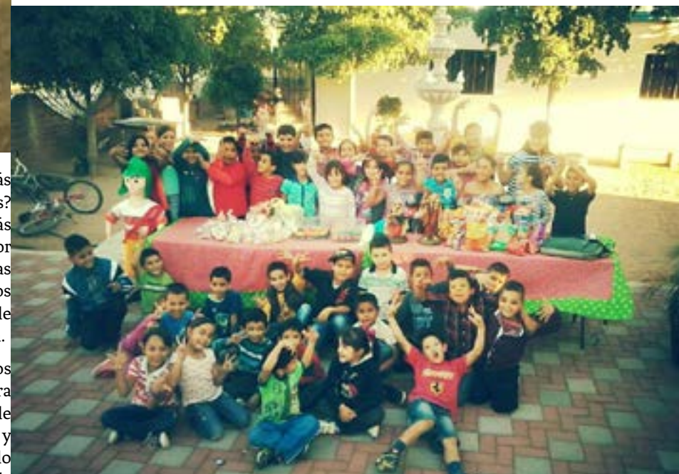
Convivencia con niños en comunidad de fundición

Como era de esperarse nos encontramos con muchas sorpresas, conocimos muchas personas y sobre todo encontramos a Cristo en cada una de ellas. Esta misión fue una oportunidad que Dios nos dio para encontrarnos con Él en dichas comunidades donde aprendimos tanto de cada una de las personas con las que hablabamos, visitabamos o teniamos algún trato a diario.