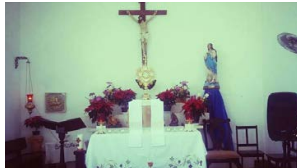
Exposición del Santísimo Sacramento

entusiasmados por saber la razón de nuestra presencia en la comunidad, donde podíamos darnos cuenta de la gran energía que tenían, las ganas de jugar y aprender. Podrían describirse como pequeñas chispas que nunca se apagaban, por eso en ellos hay tanto que aprender, tanta energía y a la vez tanta nobleza que hay en cada uno de ellos. Hubo momentos de juego, diversión, de risa y de seriedad. También compartimos nuestras habilidades y virtudes en distintos juegos y en ocasiones en juegos de beisbó y partidos de futbol donde sacamos a ese deportista que llevamos dentro.