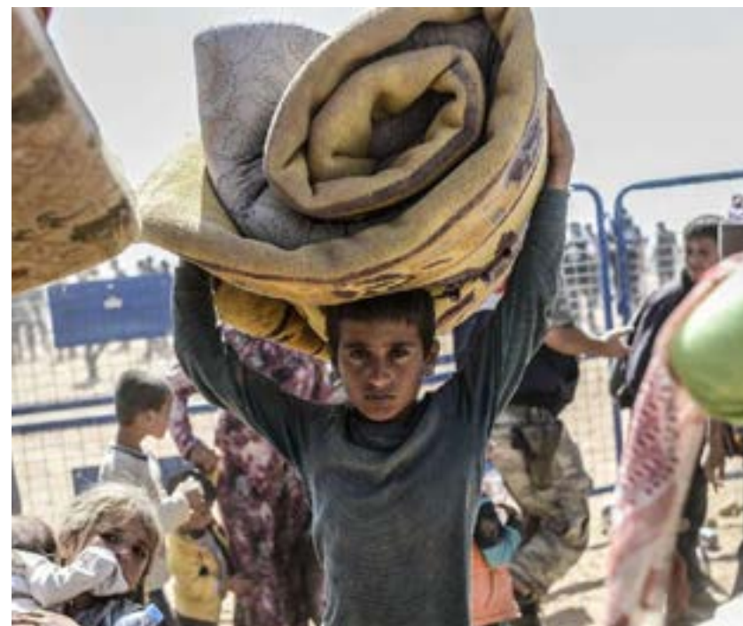
Niños, jóvenes y adultos, familias completas sirias buscan refugio seguro.

Enfocándonos en Siria, por la triste realidad que están viviendo sus habitantes que buscan refugio en otros países, vemos claramente la situación descrita en párrafos anteriores, junto con otros aspectos políticos militares. Tiene muchos antecedentes muy antiguos, pero partamos de la dictadura de Hafez al-Assad, quien gobernó de 1971 a 2000. Curiosamente "Asad", en árabe significa: León. Solamente que este nefasto militar fue un león cruel, sanguinario, represor, implacable. Está documentada la forma en que aplastó a sus opositores, al grado de él mismo ufanarse de su capacidad para asesinar a sus enemigos de su mismo país. Persiguió a los pocos católicos de esa época, y a los de otras religiones. Incluso a los musulmanes que no pertenecían a su minoría religiosa Alahui Chilí, que él promovía y a la