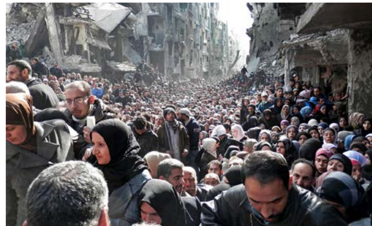
Ante un panorama tan desolador, a los sirios no les ha quedado más que huir de ese infierno.

Por lo tanto, a los sufridos sirios no les ha quedado otra alternativa que huir de ese infierno. Las noticias presentan imágenes impresionantes, en donde se observa a filas de familias, caminando en busca de un país que los acepte. No traen equipaje, no traen papeles migratorios, seguramente