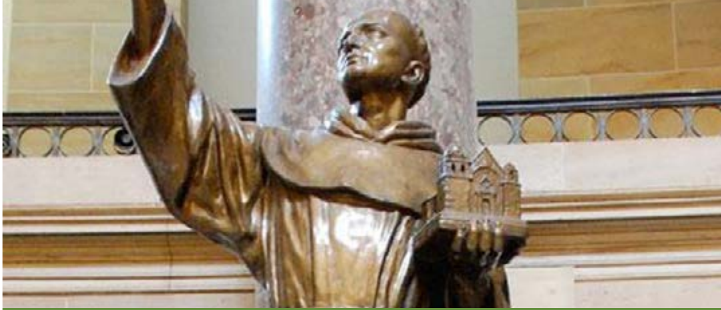
Monumento público del capitolio de los Estados Unidos de América en Washington, D.C.

Pidamos a Dios que este acontecimiento, de tener a tan ejemplar misionero como Santo, crezca la evangelización en todo el mundo, pero particularmente en México y en Estados Unidos. Que la misión Me invitan a visitar a una pareja que ya no iniciada por este Santo, sea continuada y puede salir de su hogar. Veo ante mí una gran fortaleza por religiosos y laicos de ambos países. San Junípero ruega por nosotros, y logra que Dios fortalezca a nuestra Iglesia Católica.